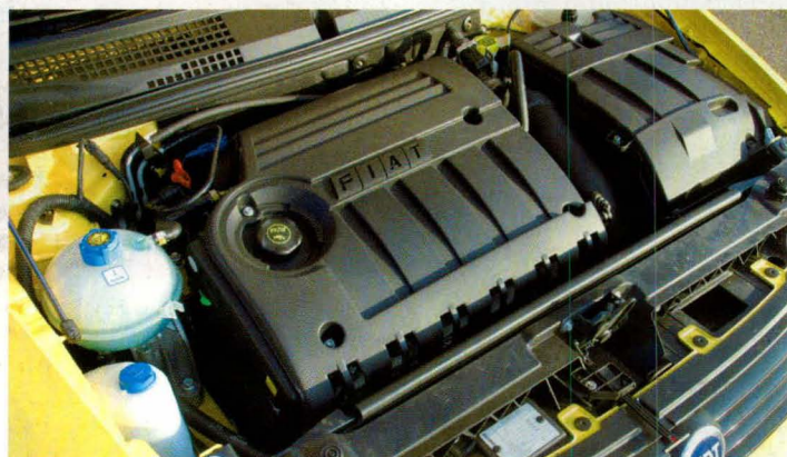
De 2,4-liter vijfcilinder motor levert 170 pk. Hij is in de Abarth alleen gekoppeld aan een Selespeed-versnellingsbak.