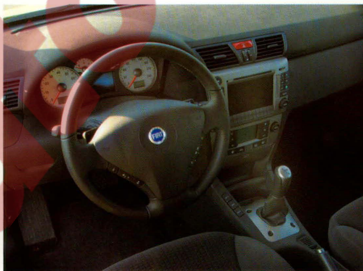
Links: De 17-inch wielen zijn een optie. Midden: De witte wijzerplaten geven het strakke dashboard een sportief accent. Rechts: Met de joystick-achtige pook kan de sequentiële vijfbak worden bediend.